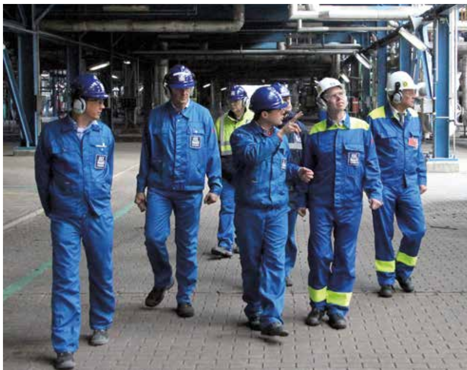
CEO Svein Tore Holsether, tweede van rechts op de foto, liet zich tijdens een rondleiding uitgebreid voorlichten

Na de lunch – waar Svein Tore in een paneldiscussie met verschillende medewerkers in gesprek ging – werd koers gezet naar WarmCO2. De nieuwe CEO was onder de indruk van Yara Sluiskil als een van de belangrijkste fabrieken binnen het concern en ook het WarmCO2 project oogste lof van Svein Tore.