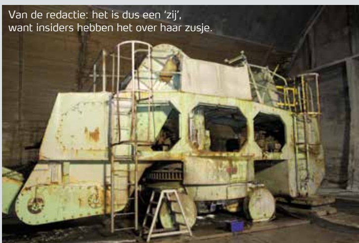
Van de redactie: het is dus een 'zij', want insiders hebben het over haar zusje.

‘We wisten dat we binnen afzienbare tijd onderhoud zouden moeten plegen aan de krasser,’ aldus Ruud Meima, Support Engineer. ‘De machine voldeed echter niet meer aan de huidige normen om dit onderhoud naar behoren en veilig uit te voeren. Daarom werd beslist om de krasser te slopen en te vervangen door een laadschop met trechter. Haar zusje in silo1 hadden we twee jaar geleden al vervangen.’